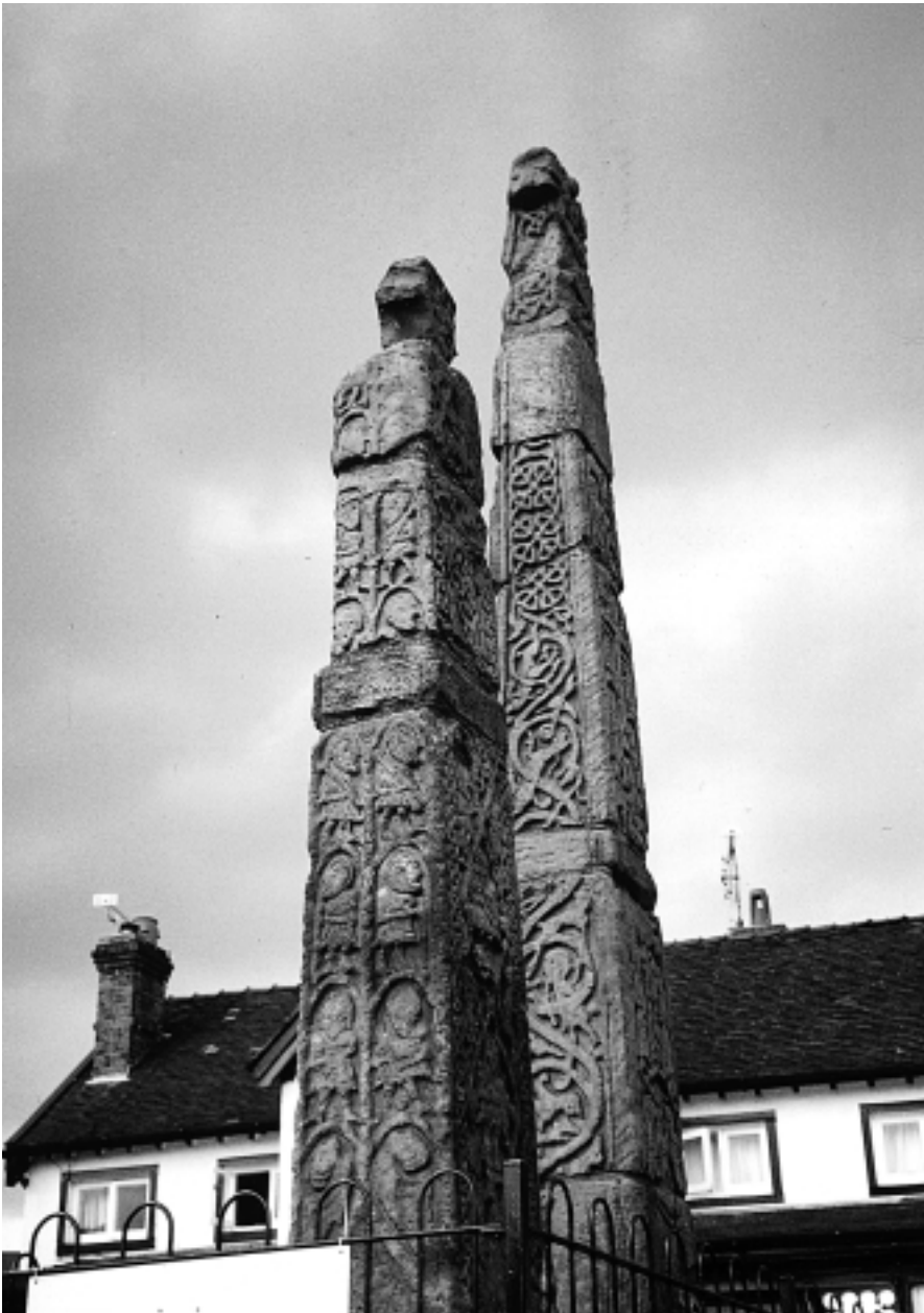
To rikt dekorerte steinkrossar frå landsbyen Sandbach, Chesire, England. Frå 700-800-talet. Krossarmane øvst vart øydelagde av puritanske kristne på 1600-talet.