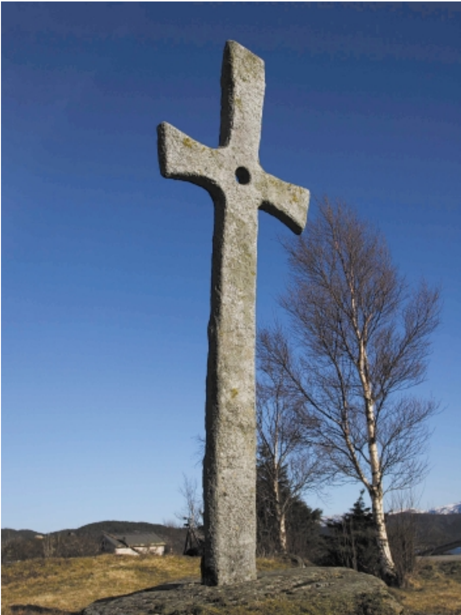
Korssundkrossen er ein av dei største krossane på Vestlandet, omlag 4 meter høg. Den er hoggen av granatglimmerskifer frå Hyllestad. Krossen er fundamentert i ei heil kvadratisk steinhelle, kring 1 x 1 meter, med hol tilpassa krossfoten.