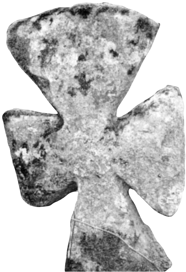
Steinkross på Hyllestad gamle kyrkjegard.