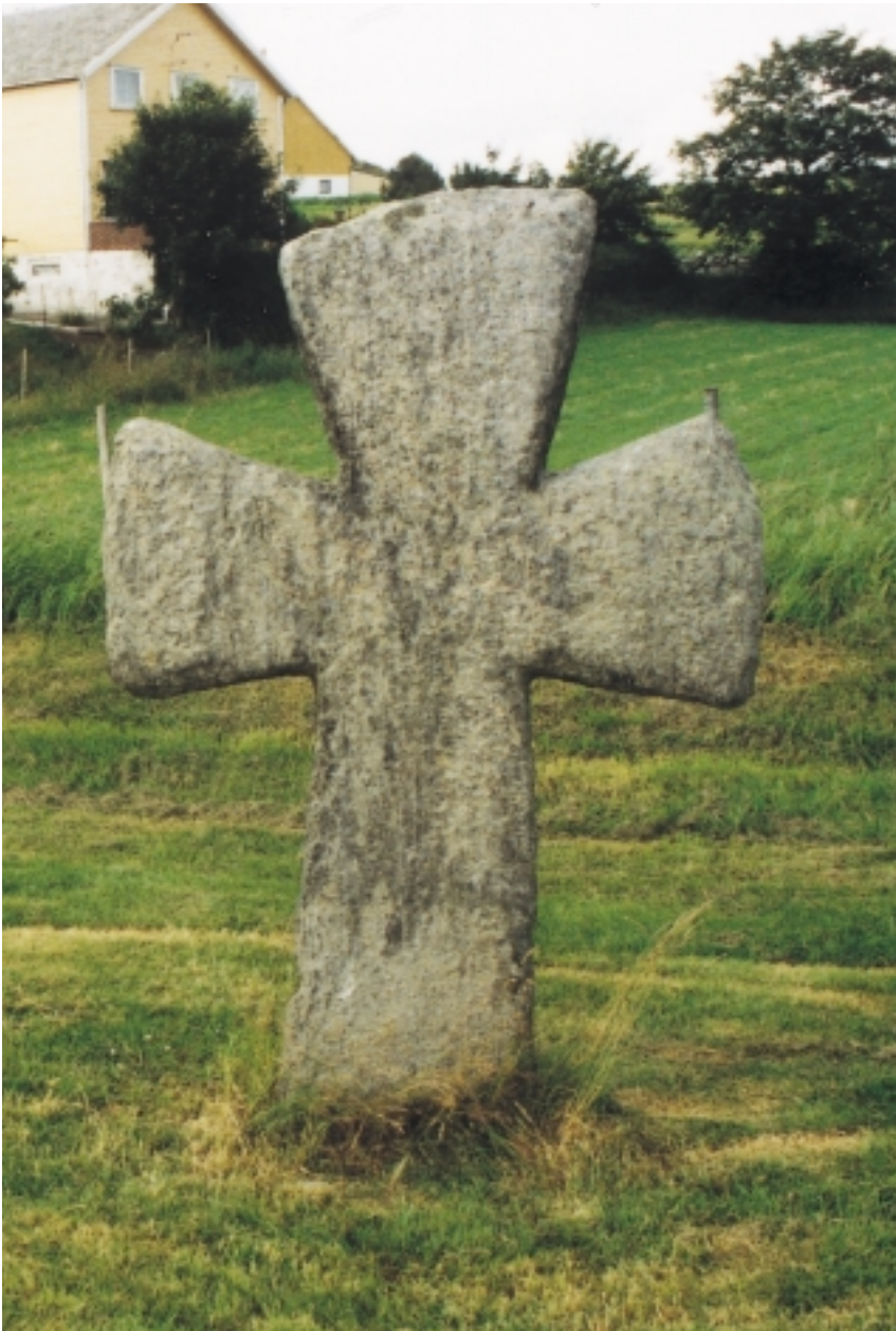
Ein av krossane på Tjora, noko under 2 m høg, hoggen av granatglimmerskifer frå Hyllestad.