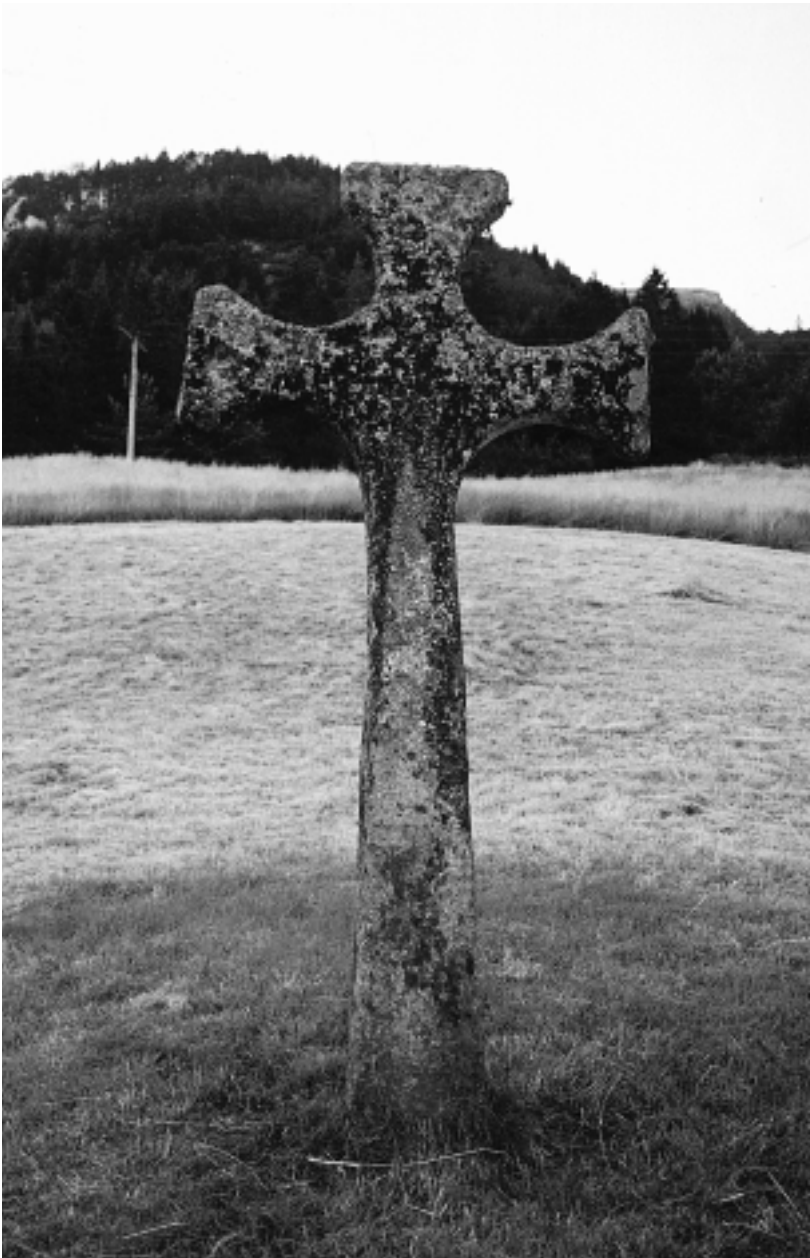
Krossen i Krossteigen i Eivindvik, 2,65 m høg. Denne kan ha hatt sitt opphav i samband med gulatingstaden. Like ved ligg kyrkja, og ved kyrkjegardsmuren står endå ein kross. Denne har spor av kvernsteinsuttak.