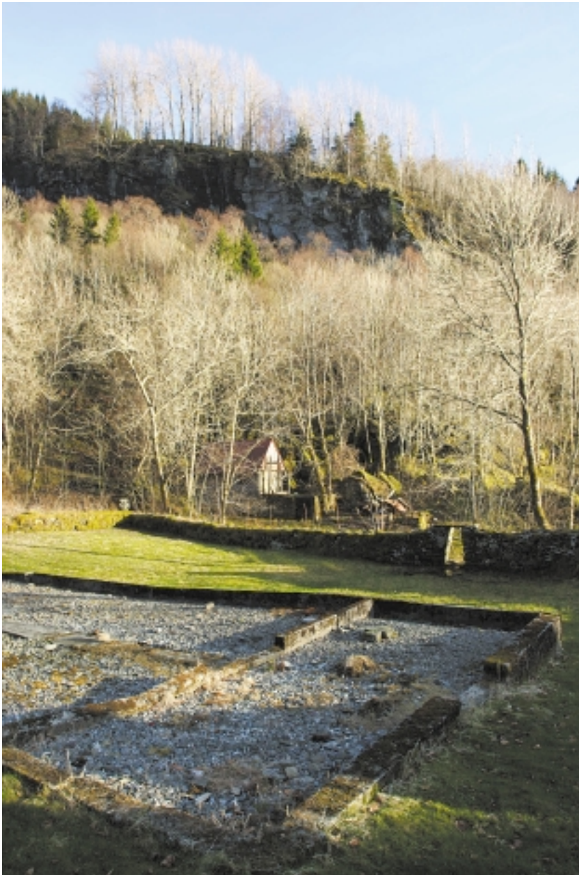
Hyllestad gamle kyrkjegard, med ein steinkross i kvart hjørne. Den støypte muren syner kvar kyrkja stod, og staden ligg lunt til under fjellet, sør- og vestvendt.