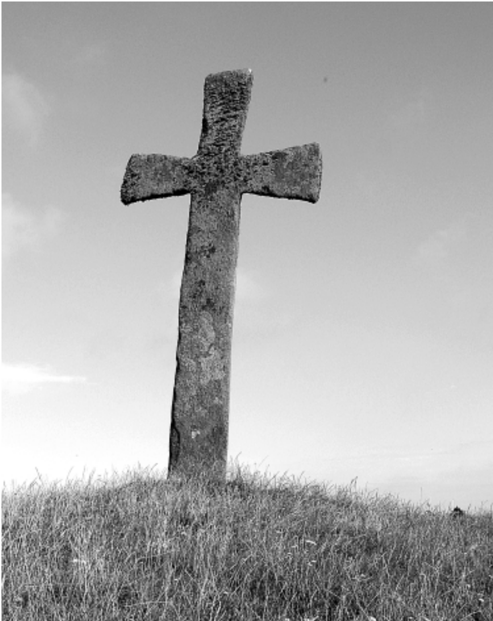
Steinkross på Kvitsøy. Hoggen av granatglimmerskifer frå Hyllestad, ca. 4 m høg.