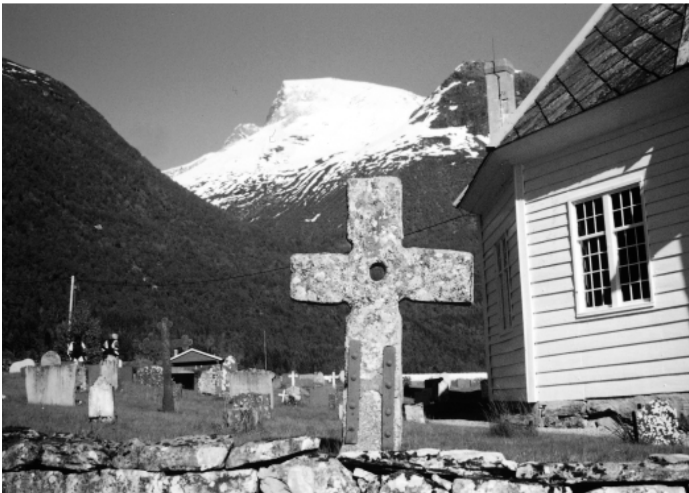
Loenkrossen på Loen kyrkjegard. Krossen er 2 m høg, og vart truleg opphavelag plassert i Korsvika, der tidlegare dampskipskai låg. Dette er den krossen vi finn reist lengst inne i fjordane.