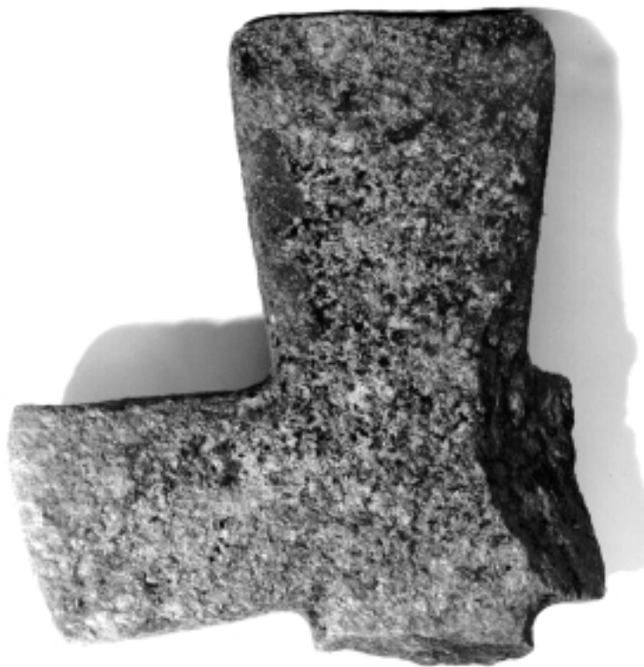
Øydelaagd steinkross funnen på Rønset.